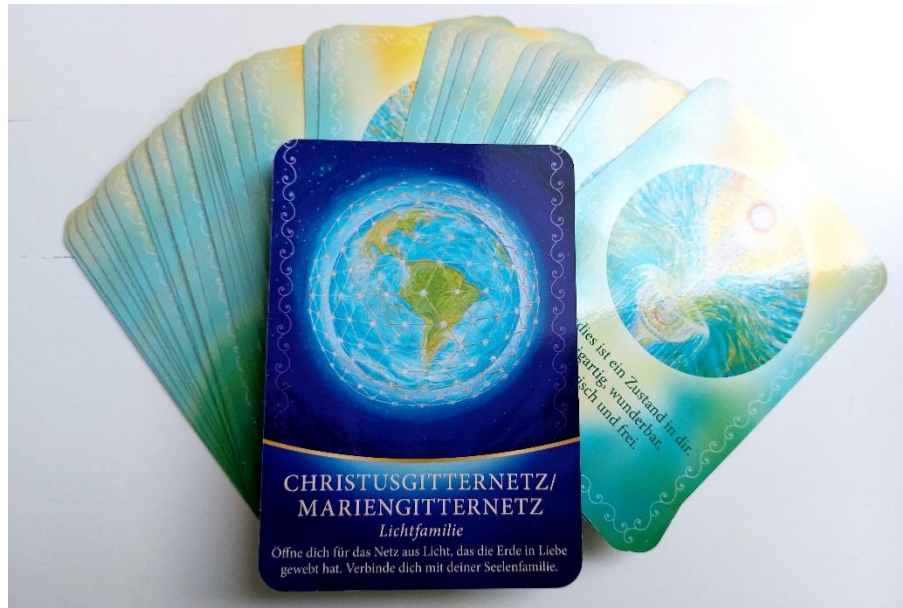
Karte zur Zeitqualität