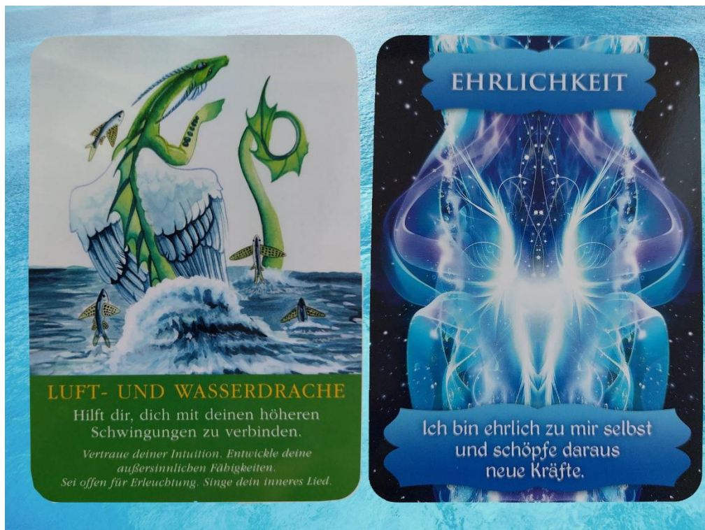
Karte zur Zeitqualität