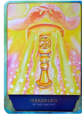
Karte zur Zeitqualität

Der Baldrian Valeriana officinalis ist eine recht bekannte Heilpflanze, auch wenn er eher weniger in unseren Gärten wächst. Er wächst in ganz Europa und wurde früher als Allheilmittel eingesetzt. Mittlerweile kennt man ihn eher wegen seiner stimmungsaufhellenden Wirkung bei Depressionen, er löst Anspannungen und Stress und hilft bei Schlaflosigkeit. Da er sowohl beruhigend als auch konzentrations-fördernd und stimmungsaufhellend wirkt, ist der Baldrian ein Kraut, das sehr ausgleichend auf den Körper wirkt. Zusätzlich hat er auch eine krampflösende Wirkung. Aus seinen Blüten kann man Tee kochen und seine Wurzeln eignen sich gut, um eine Tinktur herzustellen. Bei Schlafproblemen kann man die Blüten auch wunderbar in Form eines Schlafkissens nutzen.